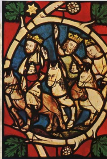
Dreikönigfenster, Erfurter Dom, um 1370